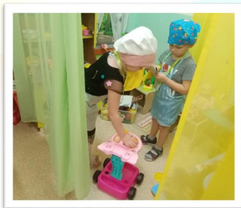
Повара интернет кафе