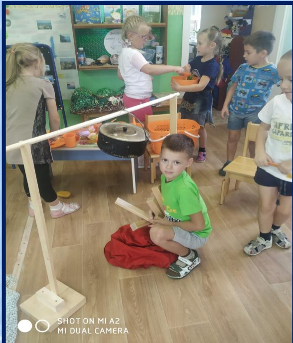
SHOT ON MI A2 MI DUAL CAMERA