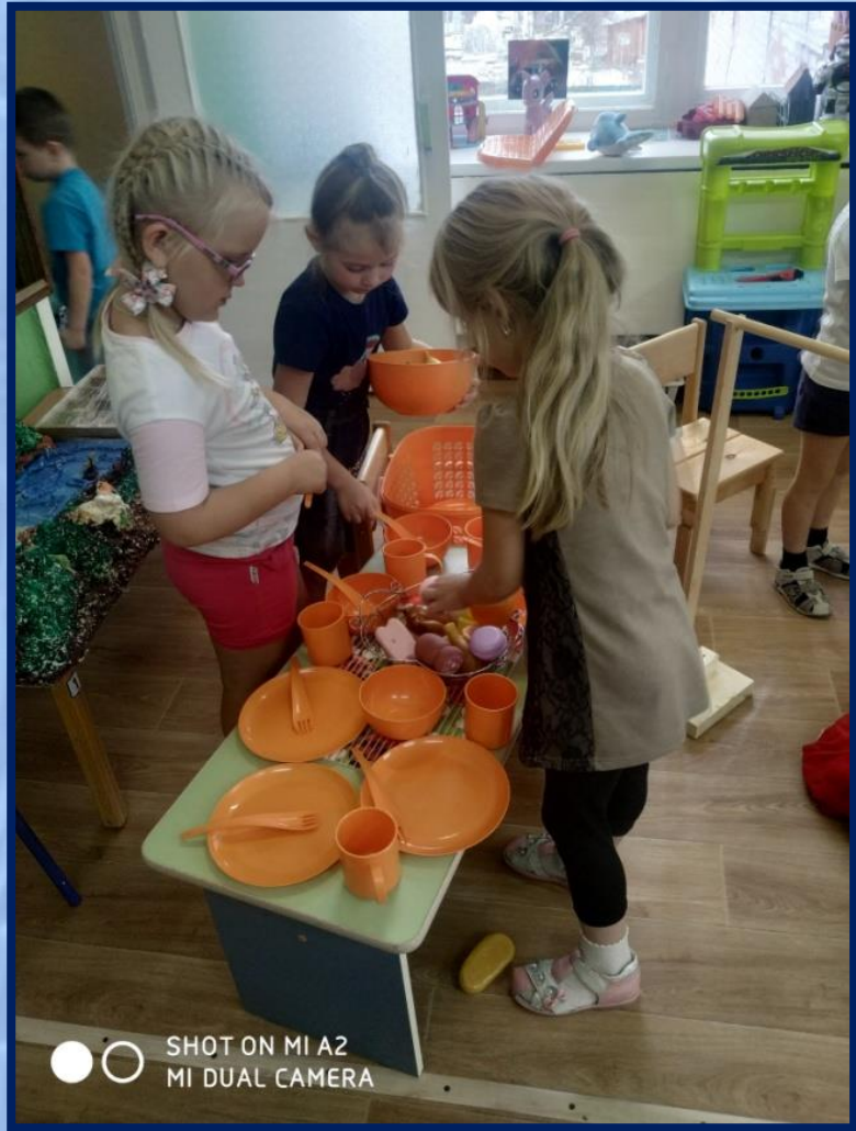
SHOT ON MI A2 MI DUAL CAMERA