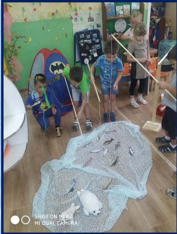
SHOT ON MI A2 MI DUAL CAMERA