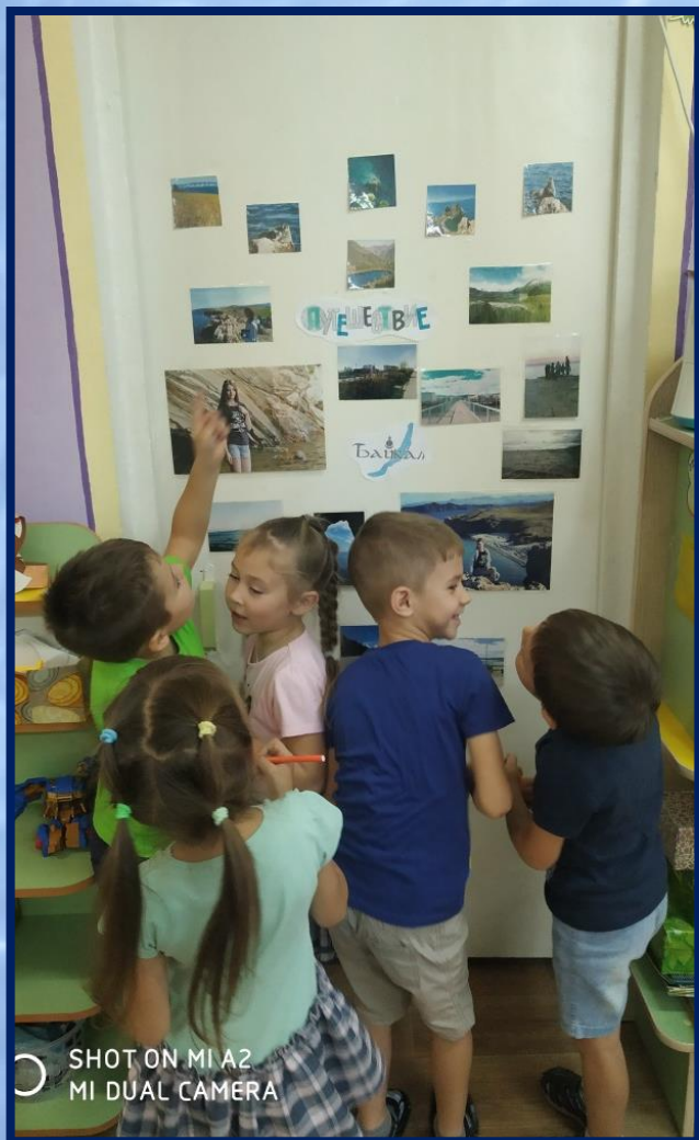
ФОТО ВЫСТАВКА «Путешествие по Байкалу»