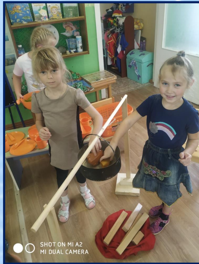
SHOT ON MI A2 MI DUAL CAMERA